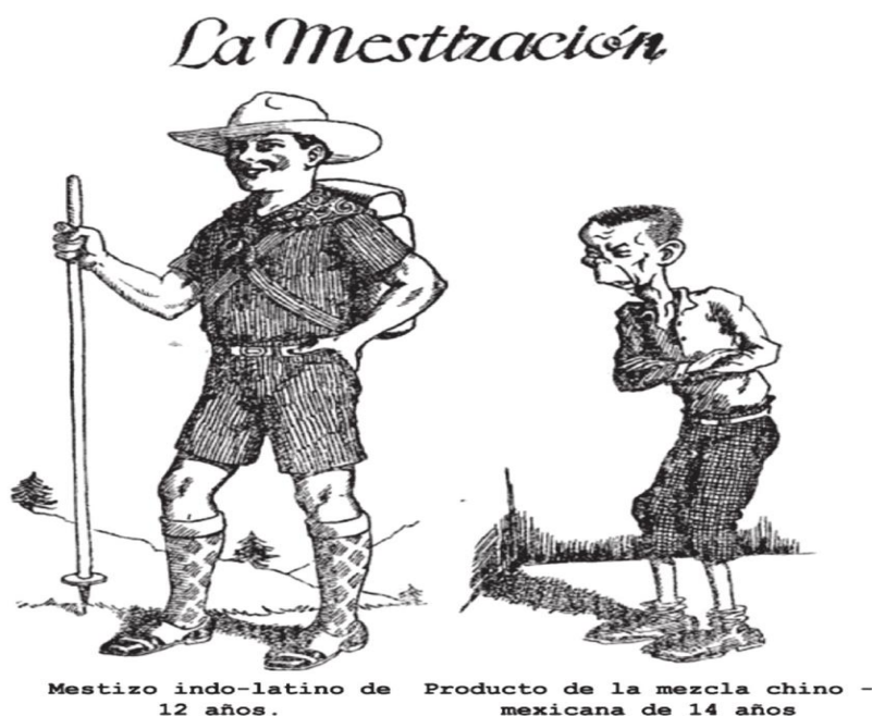
Figura 4.1. La mestización

Para el movimiento antichino los asiáticos estaban lejos de cumplir con alguna de las características raciales mencionadas. Por el contrario, se les había creado la fama de ser portadores de males congénitos, enfermedades infecciosas, costumbres culinarias insalubres y una forma de vida antihigiénica (Hernández, 2018, p. 151).