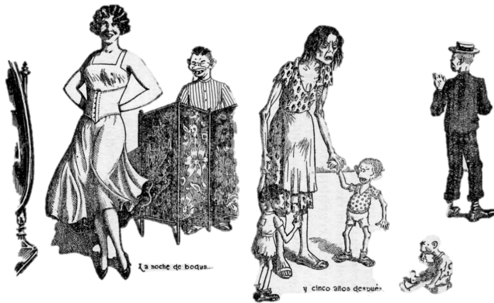
Figura 4.2. La noche de bodas