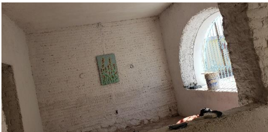
Figura: 1. Espacio que se está adaptando para Sala de estudio