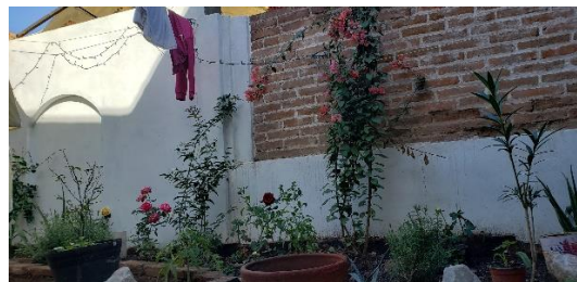
Figura: 2. Espacio exterior de convivencia